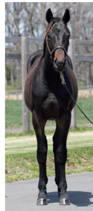
Storm Cat: M3×S5